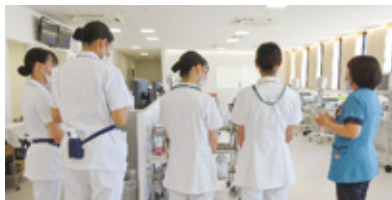
▲鳥取県立中央病院

25年度より、看護学生や未就業看護職に向けて鳥取県内の医療施設等を見学・体験する「看護サマーセミナーin鳥取」を実施しました。