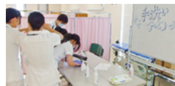
▲米子医療センター