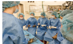
▲鳥取県済生会境港総合病院