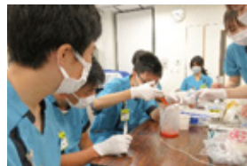
▲鳥取県立中央病院