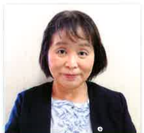
公益社団法人 鳥取県看護協会 常任理事 兼 鳥取県ナースセンター所長