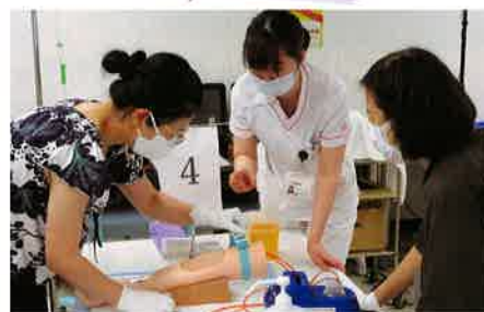
ティーチングナースによる静脈確保(演習)(西部会場)