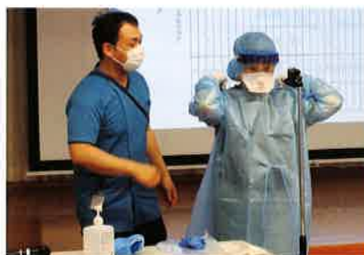
朽本感染管理認定看護師による演習(東部会場)