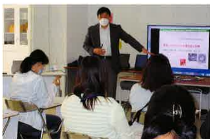
景山教授による講義(西部会場)