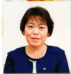
公益社団法人 鳥取県看護協会 会長

鳥取県ナースセンターは、看護職の就業促進、確保、離職防止に向けて取り組み、看護職の一人一人が活躍できるよう応援してまいります。皆さま方には、変わらぬご支援とご協力をどうぞよろしくお願い申し上げます。